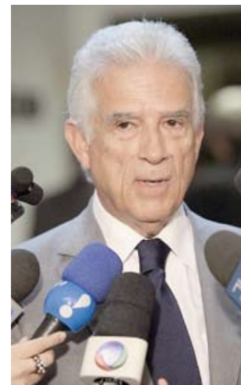
Rubens Bueno e Sandro Alex: entre os 10 melhores

Ranking dos Políticos atua na classificação e compliance do setor público por meio de ferramentas tecnológicas compiladas pelo Portal da Transparência e informações públicas de parlamentares brasileiros. Os critérios utilizados pelo Ranking são absolutamente técnicos, levando em conta fatores como assiduidade, gastos da cota parlamentar, processos judiciais e atuação legislativa. Todas as informações publicadas no Ranking são públicas, disponíveis nos sites oficiais do Senado e da Câmara dos Deputados e dos Tribunais de Justiça.