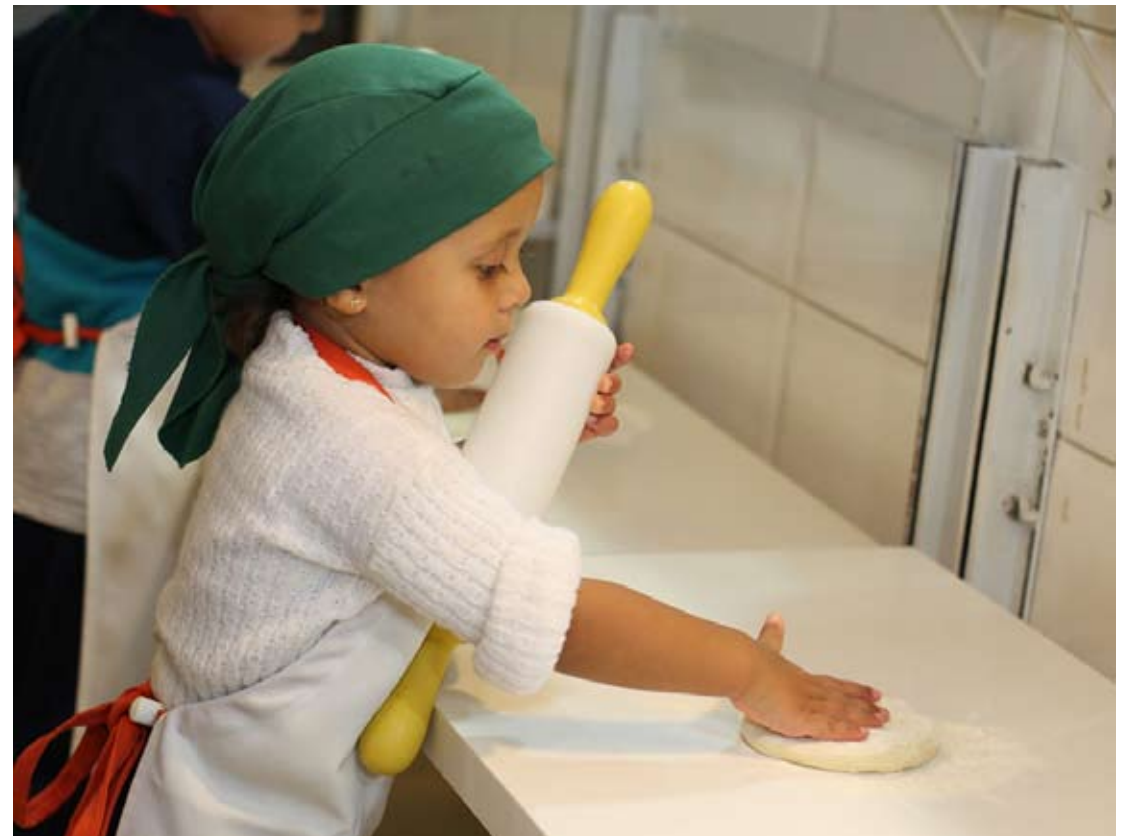
A criança abre a massa e escolhe o recheio

A criança, vestida de “chefinho de cozinha” e com chapuzinho de cozinheiro, recebe uma massinha de pizza tamanho brotinho, o