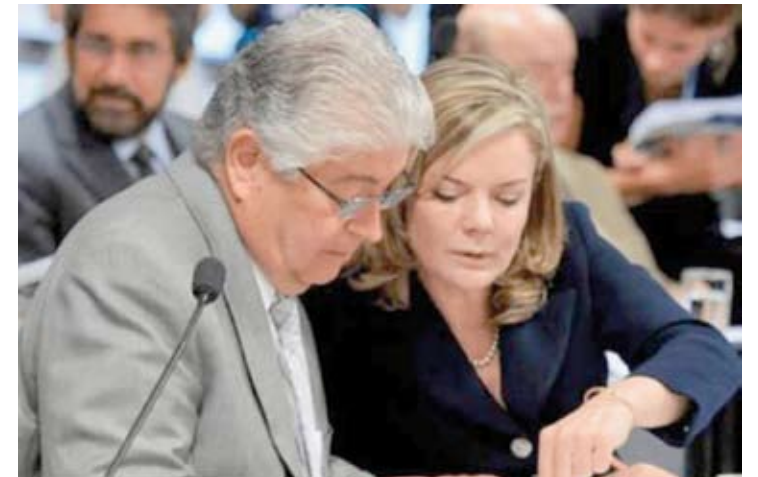
Requião e Gleisi: muito mal na foto