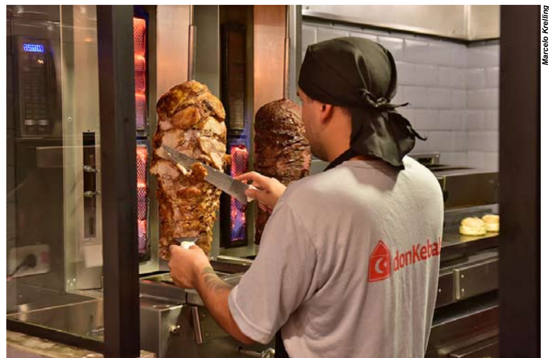
Os kebabs são preparados em espetos giratórios importados

A Don Kebab tem no cardápio uma série de sanduíches clássicos da culinária turca, também conhecidos como shawarmas, em versões adaptadas para o mercado brasileiro, sendo a única da capital paranaense com a variedade de