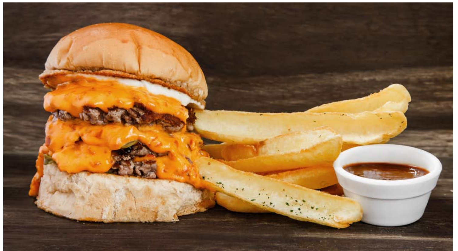
Torre Cheddaroni: três smash burgers